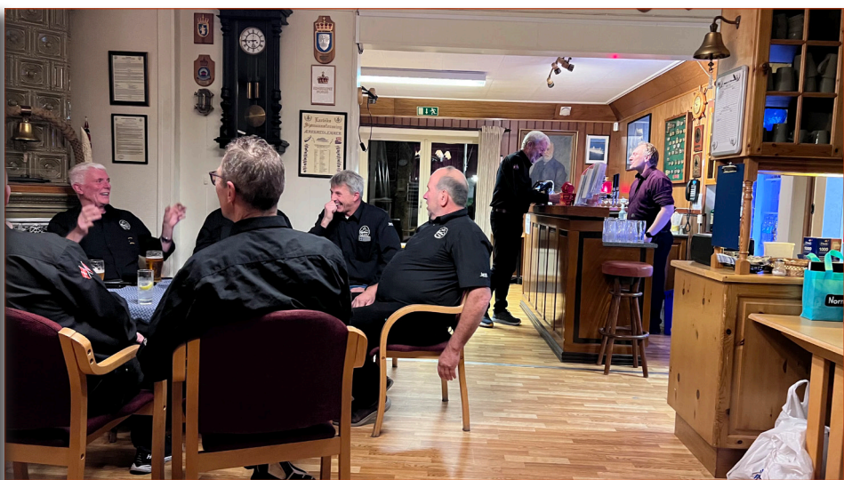
..stemingen på topp allerede før maten