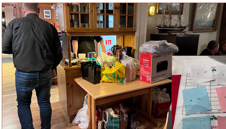
..gevinstbordet var flott og loddsalget gikk strykende