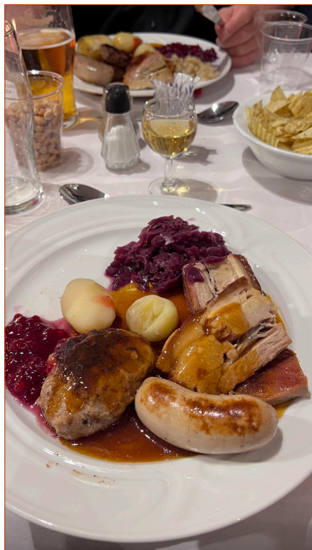
..maten var god