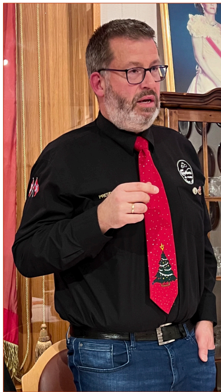
... og presidenten kunne ønske velkommen

Også i 2022 ble juleølsmakinga lagt til Sjømann. 37 øltørste var tilstede. Kjempeflott og nydelig juletallerken ble servert og 10 juleøl ble testa. Resultatet finner du i faktaboks her. Som vanlig var gevinstbordet til utlodningen kjempeflott, noe som også resulterte i godt loddsalg.